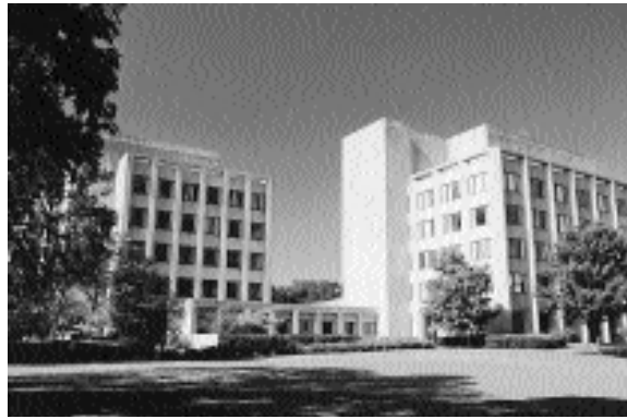
Kellogg Graduate School of Management, North Western University, Illinois

lichst viele von ihnen zumindest einen Teil ihrer Ausbildung im Ausland absolvieren. Aus diesem Grund bietet der STV seinen Mitgliedern ein «Mobility Program» an. Der Verband hat mit einer Reihe renommierter amerikanischer und kanadischer Universitäten Kooperationen resp. Absprachen für Master- oder PhD-Studien (siehe Kasten). Geeignete Mitglieder werden über eine persönliche Laufbahnberatung an eine passende Universität vermittelt. Der Autor hat bis heute über 60 HTL-AbsolventInnen beraten und ihre Platzierung unterstützt. Alle haben ihre Master- oder PhD-Studien erfolgreich abgeschlossen und die Universitäten sind sehr an weiteren Kandidaten interessiert. Es ist immer wieder eine Riesenfreude, die «Quantensprünge» der Master- und PhD-Studierenden zu beobachten. Es ist sehr zu hoffen, dass immer mehr unserer FH-Absolventen von dieser hervorragenden Weiterbildungsmöglichkeit profitieren. Informationen: Master Guide, Homepage des STV: http://www.swissengineering.ch